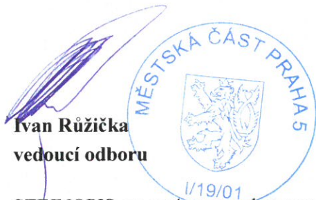
Ivan Ružička vedoucí odboru

Proti tomuto rozhodnutí lze podat odvolání podle § 81, odst. 1, zák. č. 500/2004 Sb., správní řád, ve znění pozdějších předpisů, do 15 dnů ode dne oznámení rozhodnutí k Odboru pozemních komunikací a drah Magistrátu hl. města Prahy prostřednictvím Odboru dopravy Úřadu městské části Praha 5.